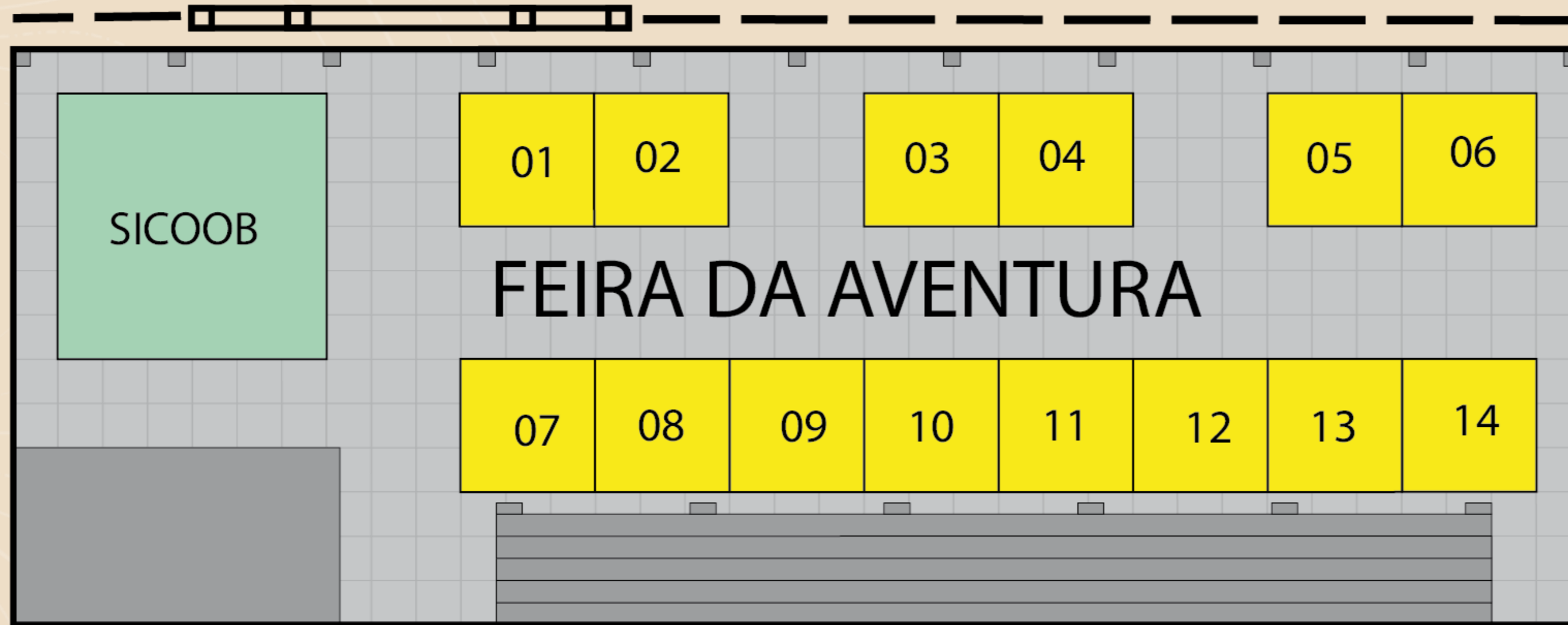
Planta Baixa da Feira